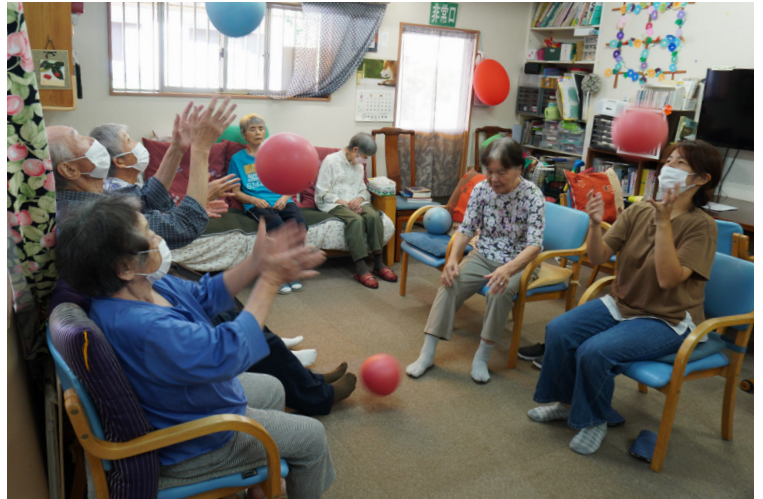
みんなの家ばおにて 楽しく体を動かしてリフレッシュ